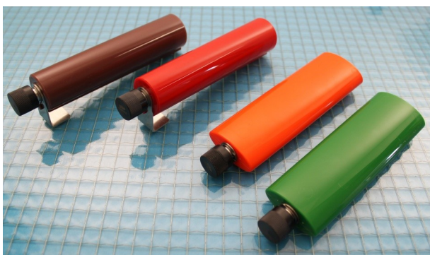
Abb. 2: Prüfkörper, runde und ovale Bauart

Der technische gke -Außendienst unterstützt bei der Auswahl des Testsystems in Abhängigkeit von der Beladung.