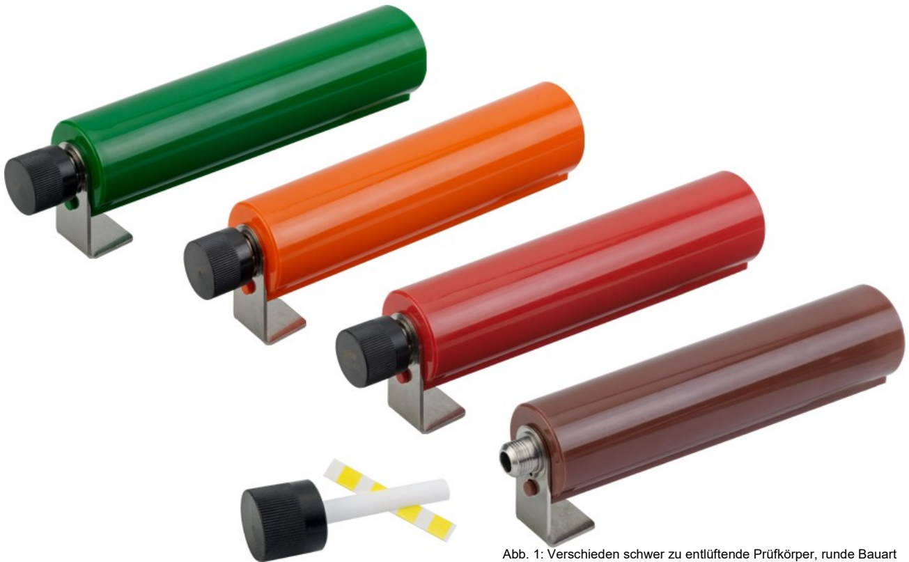
Abb. 1: Verschieden schwer zu entlüftende Prüfkörper, runde Bauart